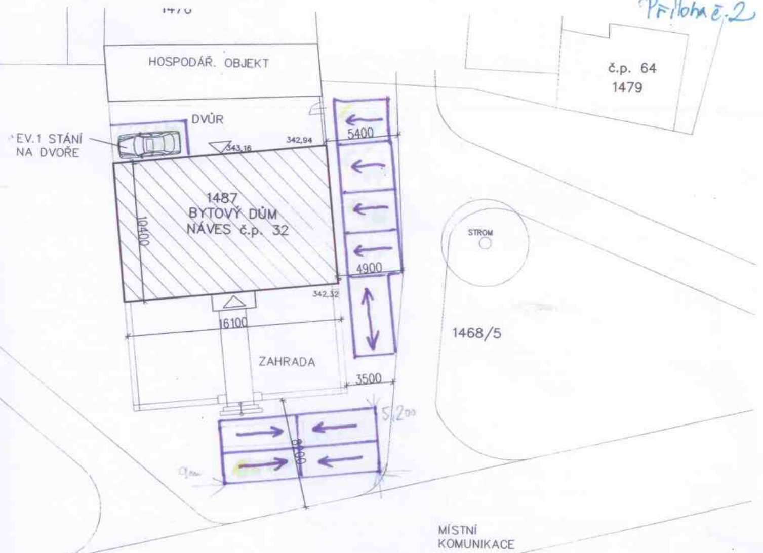
ÚHERCE – BYTOVÝ DŮM CELKOVÁ SITUACE STAVBY 1:250