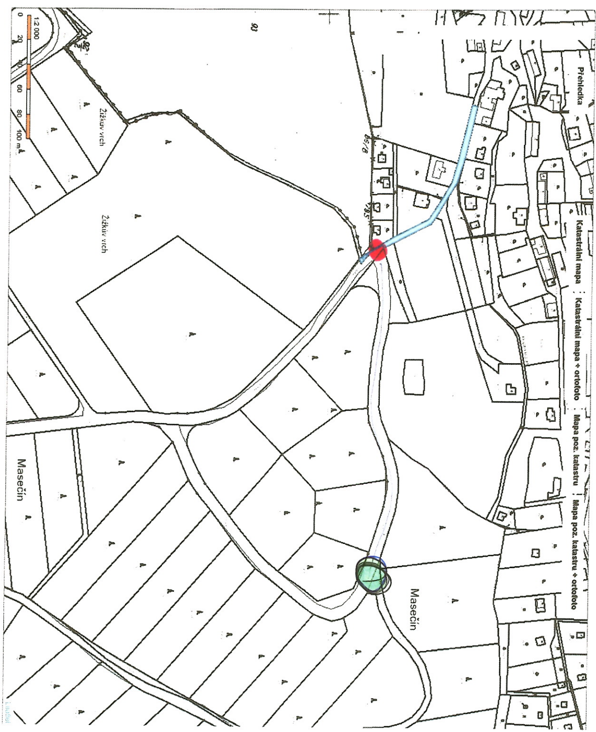
Obsah katastrální mapy a mapy pozemkového katastru se zobrazuje od měřítka 1:5000. Podrobnější informace k používání mapy, aktualizaci dat a jejího obsahu jsou uvedeny v návodě k ( EDE formát). Všechny údaje jsou součástí a detailně vypracovány pro vytyčování hranic pozemků v terénu.

010-0324702 jele o kizimacku R. Hradec Hudecove rifermugi oficialnim obpucem.