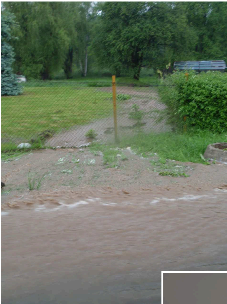
Rozliv do zahrad a domů