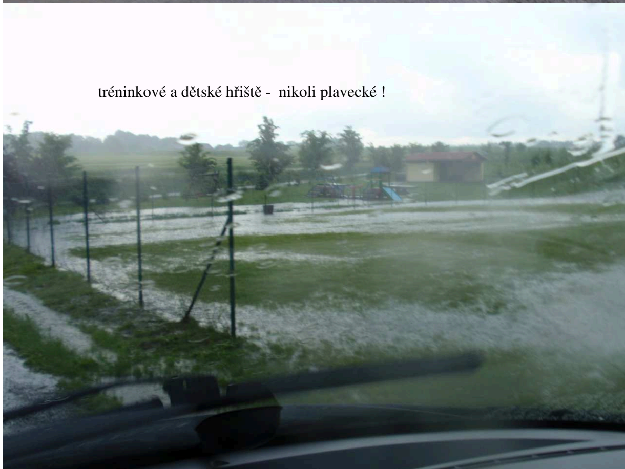
tréninkové a dětské hřiště - nikoli plavecké !