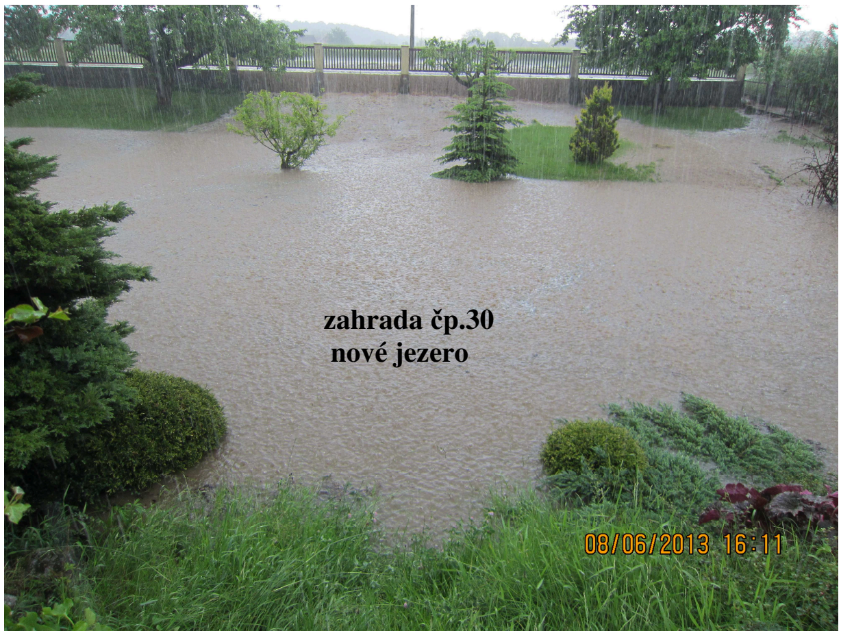
zahrada čp.30 nové jezero