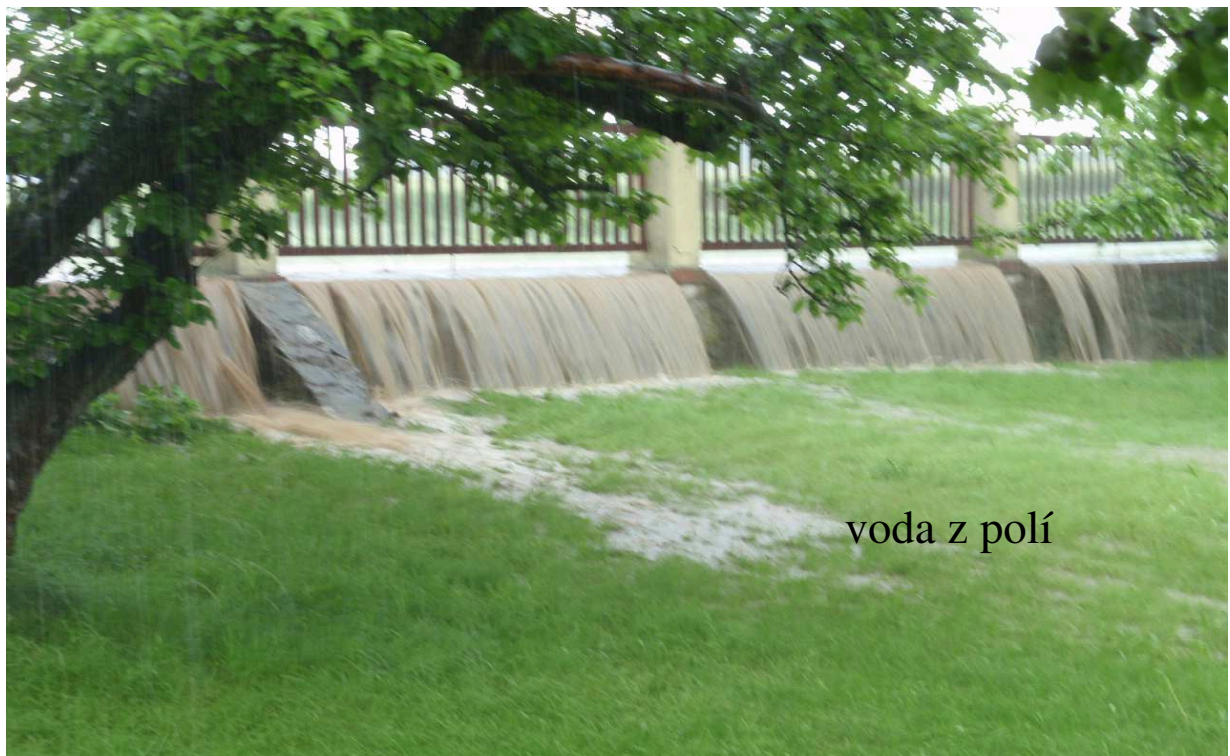
voda z polí