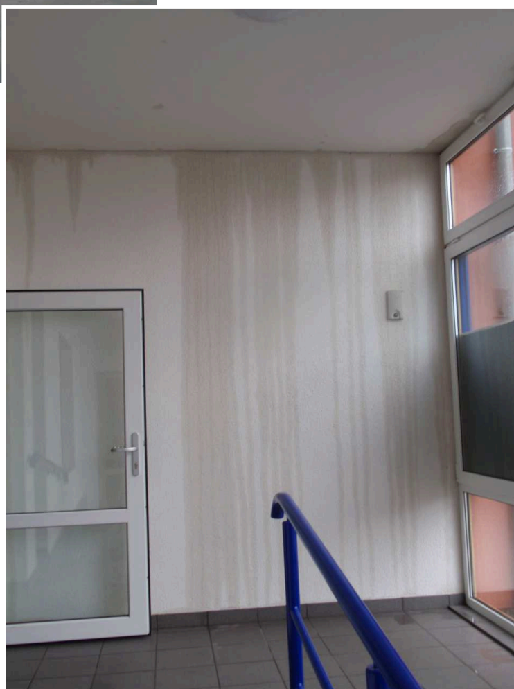
Vyplaven i nový úřad . až do přízemí