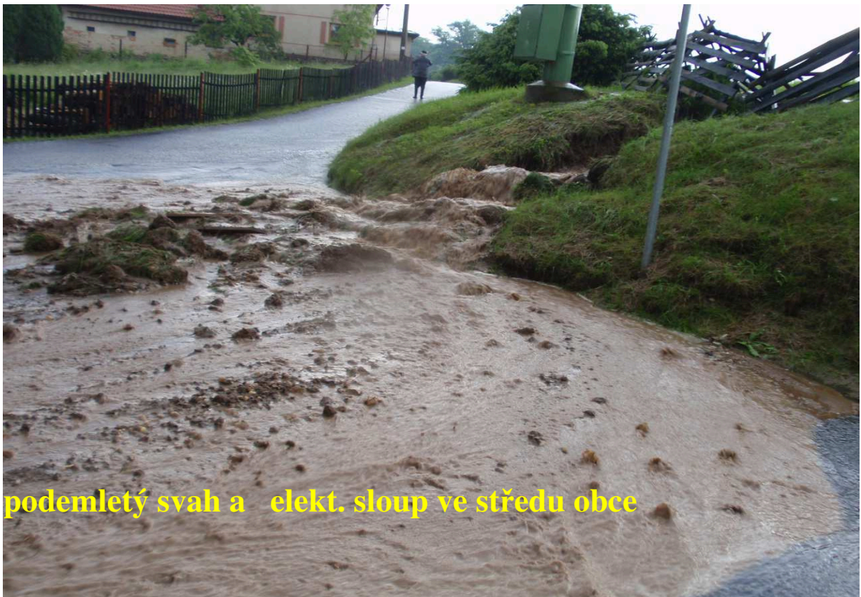
podemletý svah a elekt. sloup ve středu obce