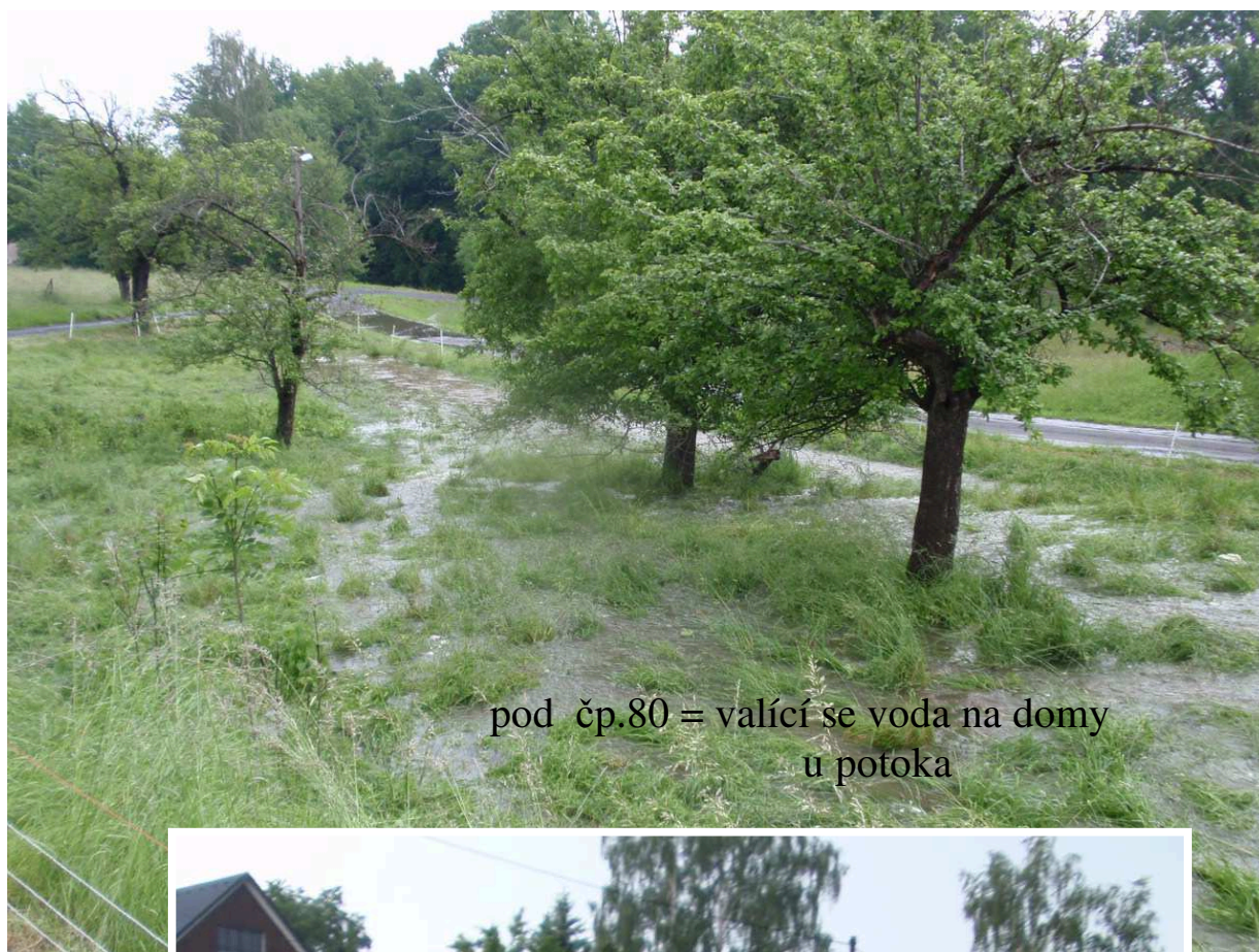
pod čp.80 = valící se voda na domy u potoka