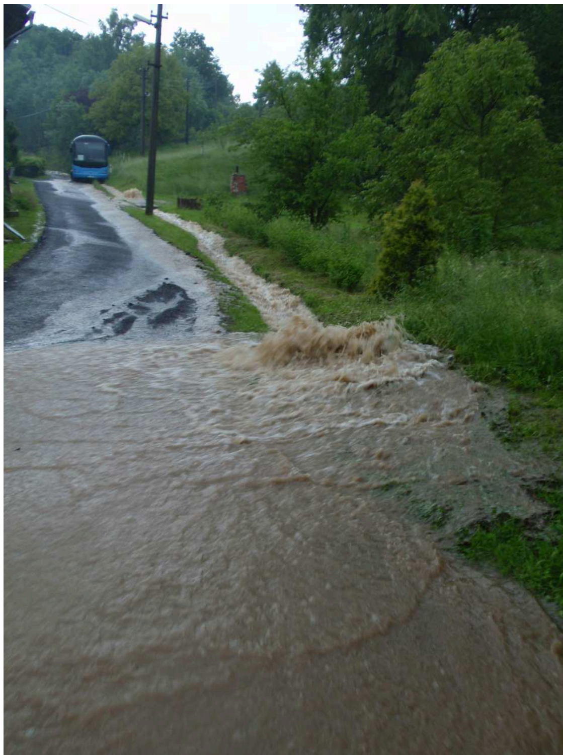
Poškozený povodňový příkop funguje, ale průchod po komunikaci vodu nestíhá. . 2011 nová komunikace .