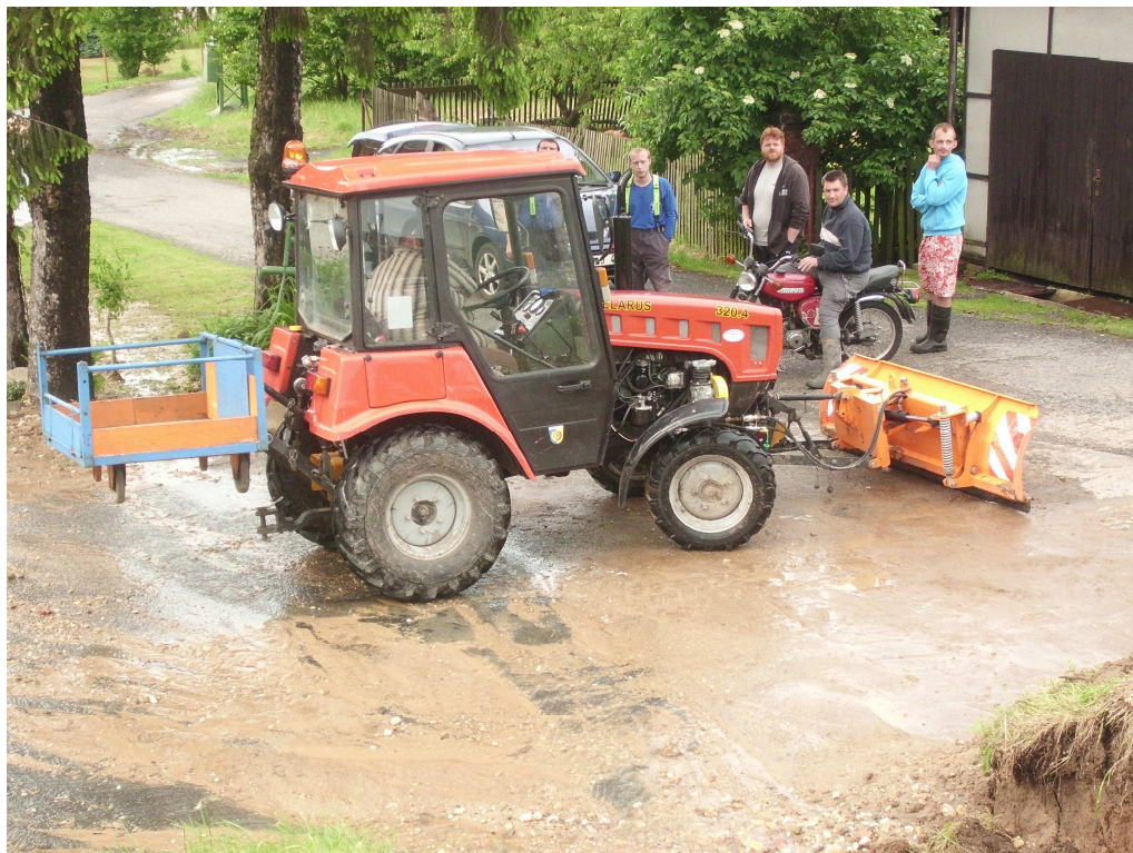
úklid bahna a kamení