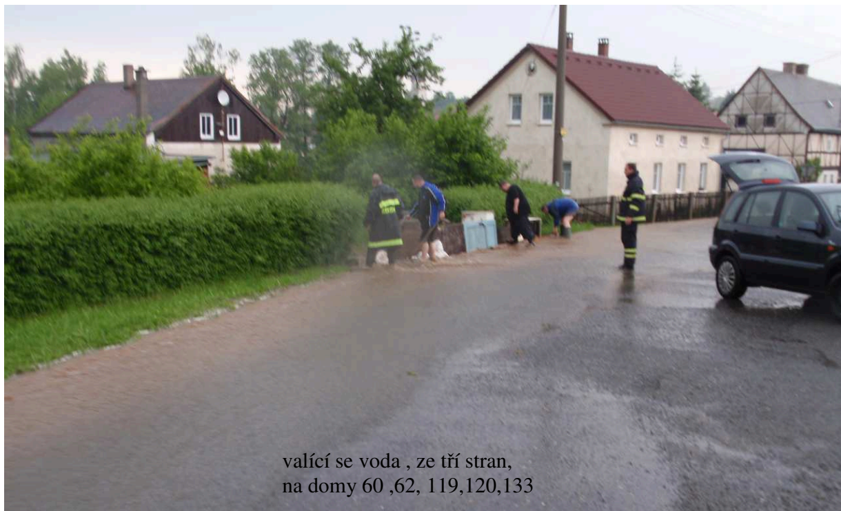
valící se voda , ze tří stran, na domy 60 ,62, 119,120,133