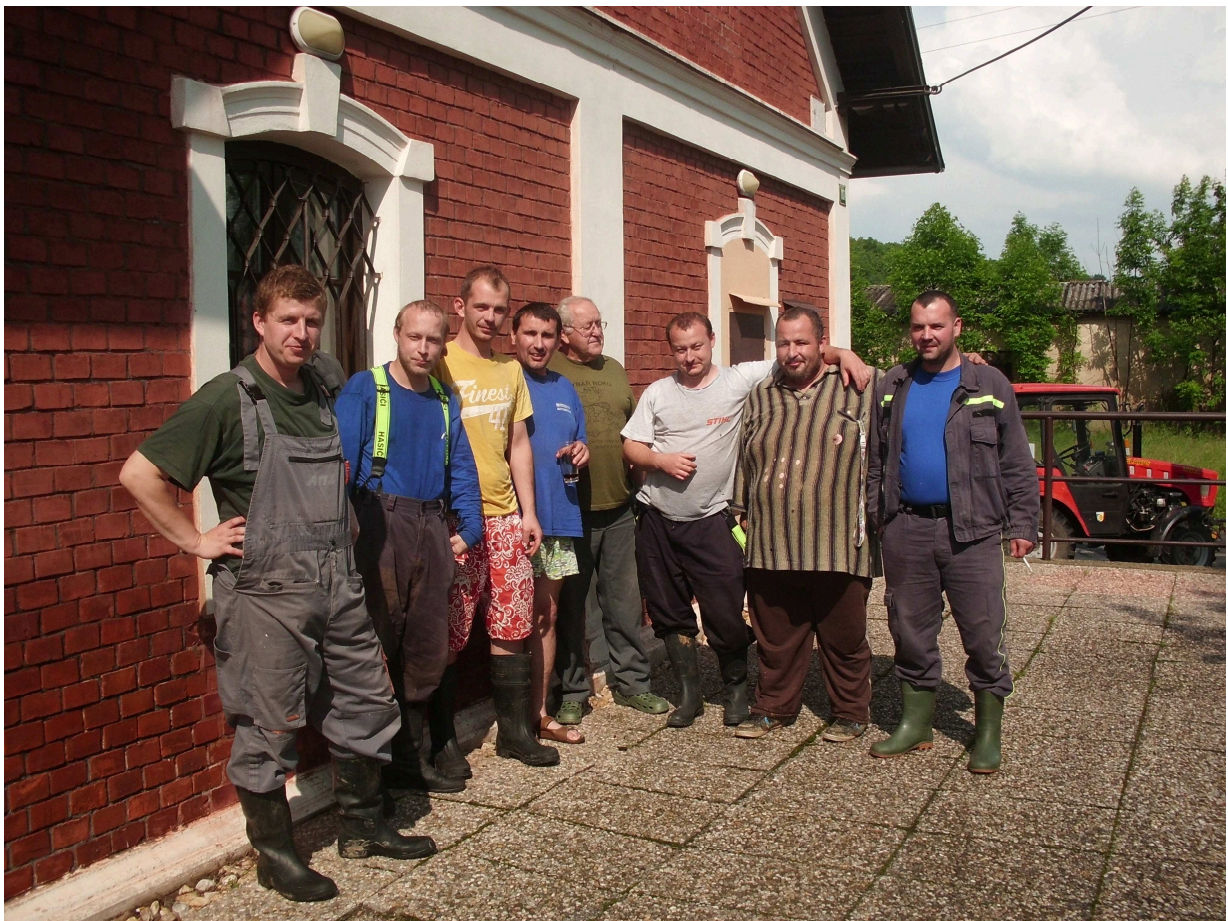
sluníčko ☺ .....a je čas na košťata a lopaty