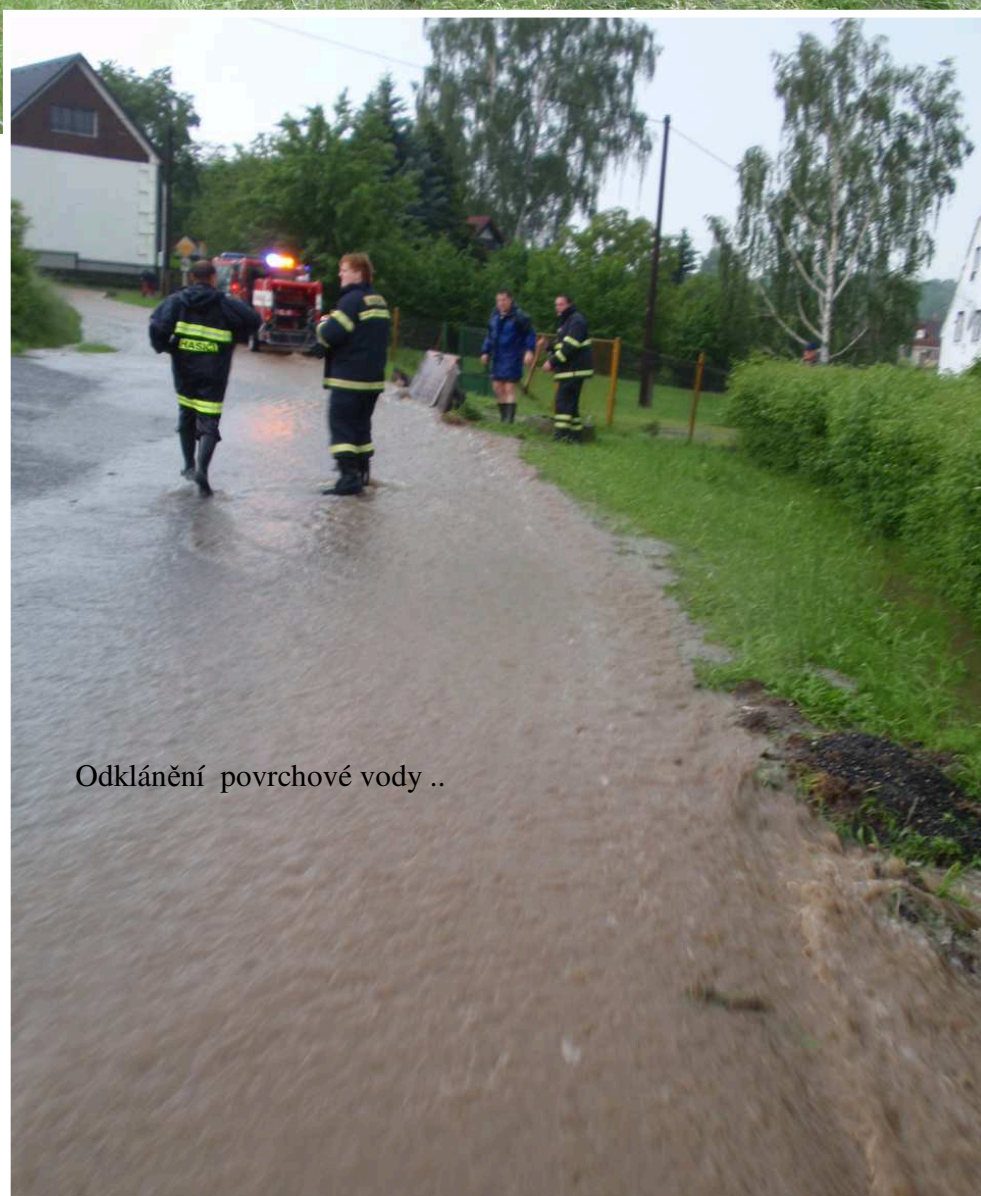
Odklánění povrchové vody ..