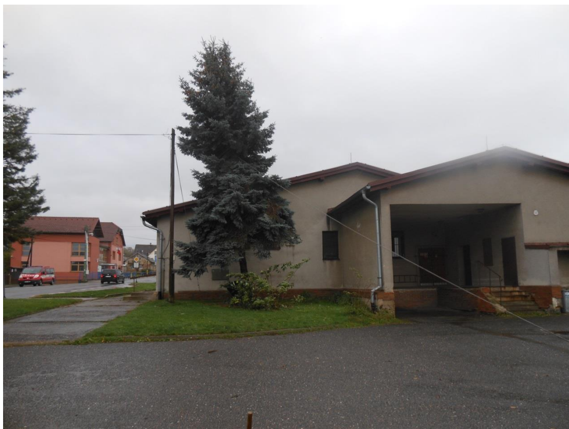
Nebezpečně vyvrácený strom v centru obce u samoobsluhy musel dolů ...