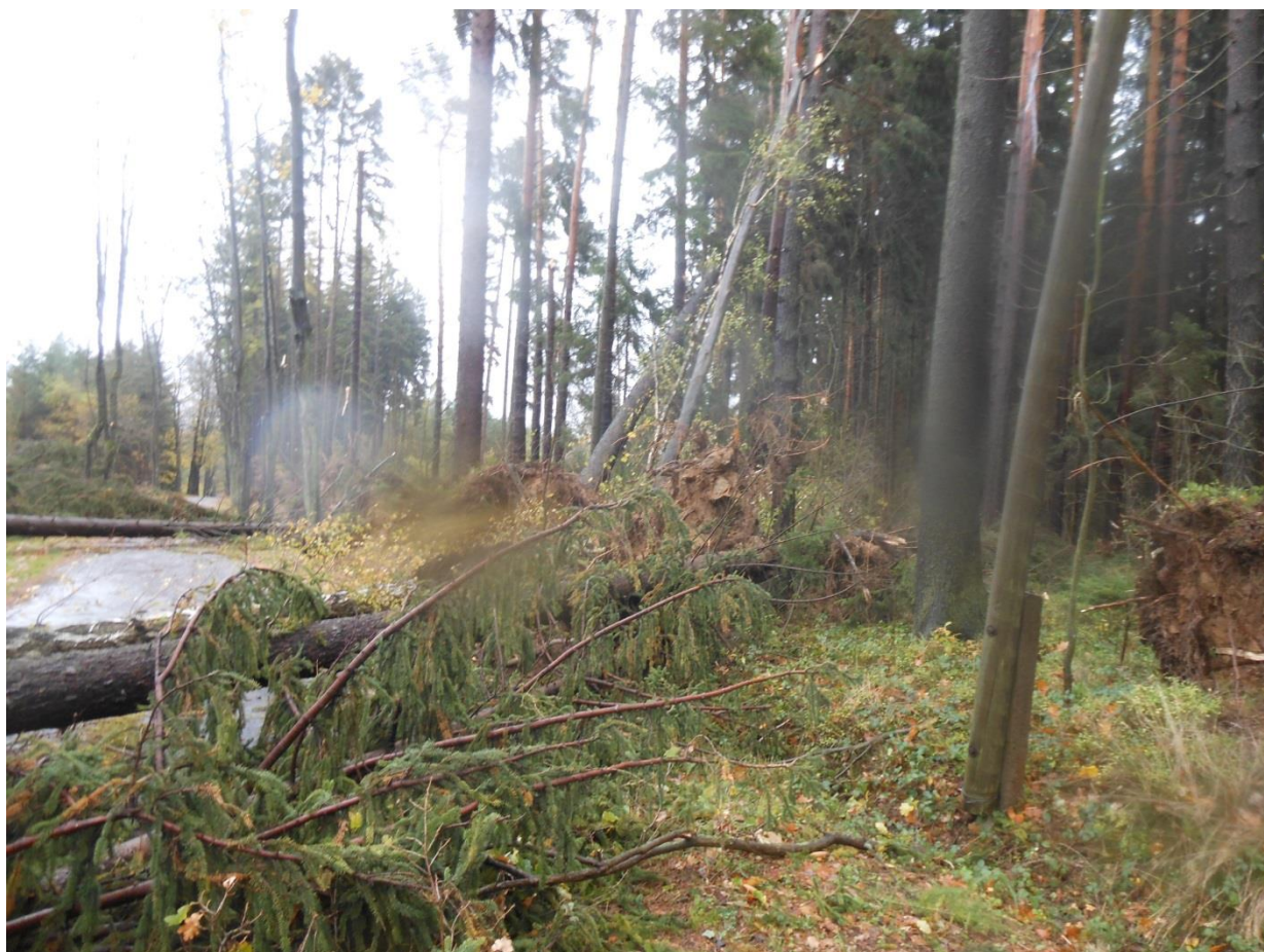
Cesta od křižovatky „U tanku“ na Háje ...