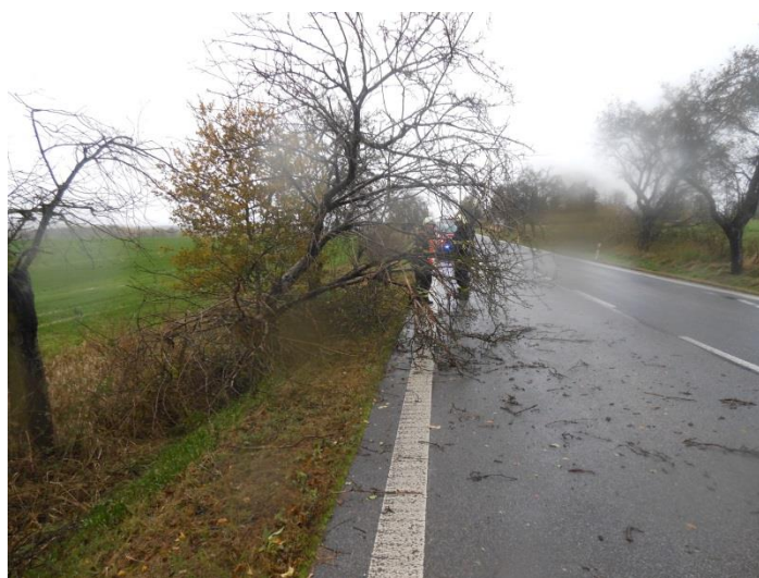
Stromy u hlavní silnice