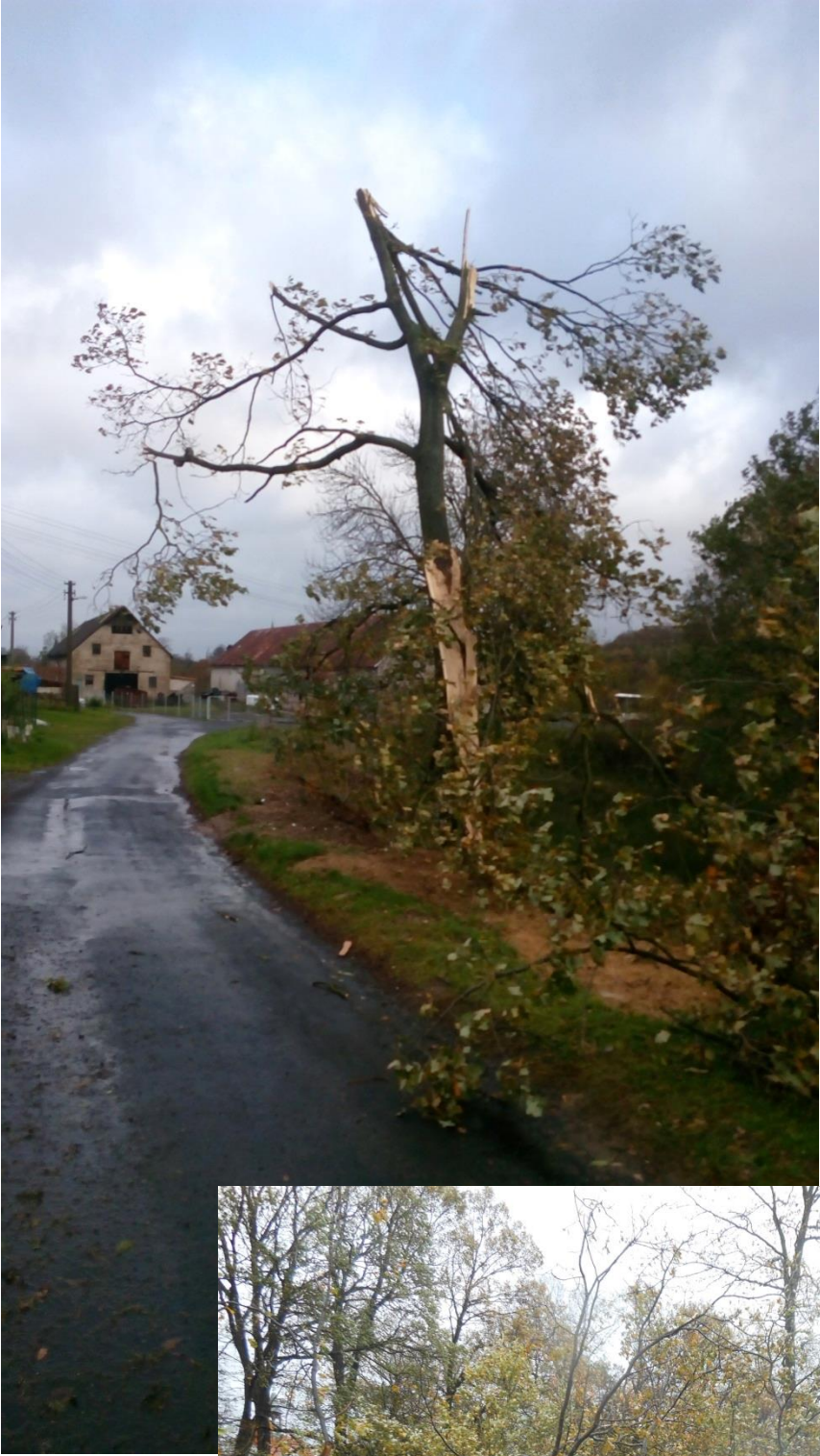
Za horními bytovkami...