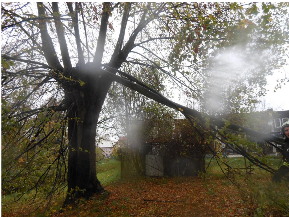
Polámaná lípa za spodními bytovkami ...