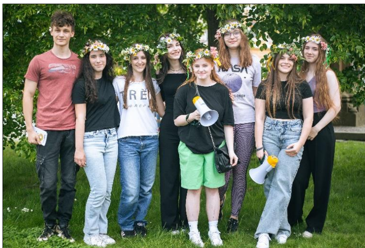
Popcorn na Jařinci (páteční prolog na náměstí)