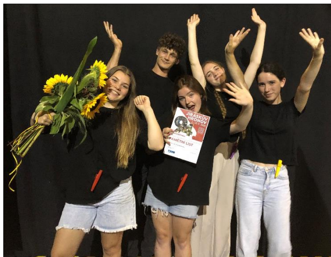
Jiráskův Hronov v pěti

a zpracování inscenace „Hostinec U Tří“. Z krajské loutkářské přehlídky DIV SE si soubor dovezl Cenu za kolektivní souhru v čistotě stylu a animaci a dobře zvládnuté loutkářské řemeslo s nominací na Loutkářskou Chrudim. Porota LCH potom ocenila inscenaci doručení na mezidruhovou přehlídku Jiráskův Hronov a Cenou za precizní loutkoherectví a skupinovou souhru. Pro účast na Jiráskově Hronovu Popcorn „Hostinec U Tří“ v srpnu přezkoušel z osmi na pět herců a vlastně znovu premiéroval v hlavním programu Jiráskova Hronova, s pěkným ohlasem.