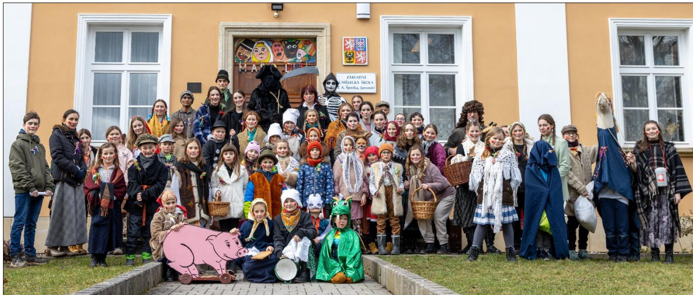
Masopustní průvod v Jaroměři