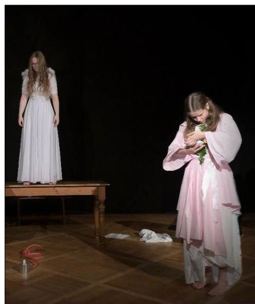
„Nová metoda“ na Loutkářské Chrudimi