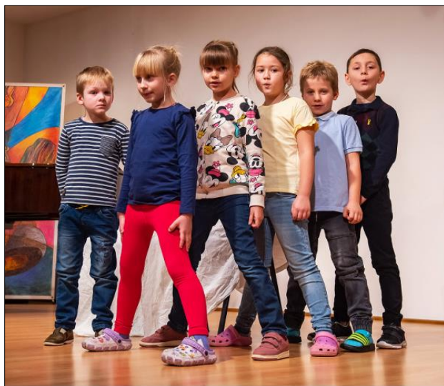
„Kominíku, kominíku, jsou komíny čisté?“

Děti z dramatické přípravy překvapily na Únorovém koncertě dramatisací zimních lidových říkadél a na Předváděčce dramataku v závěru června zahrály pohádku „Stojí v poli domeček“. Před diváky si vyzkoušely první krůčky po jevišti ve vzájemné komunikaci.