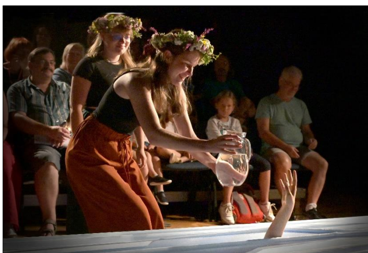
„Rusalje2022“ na Jiráskově Hronovu