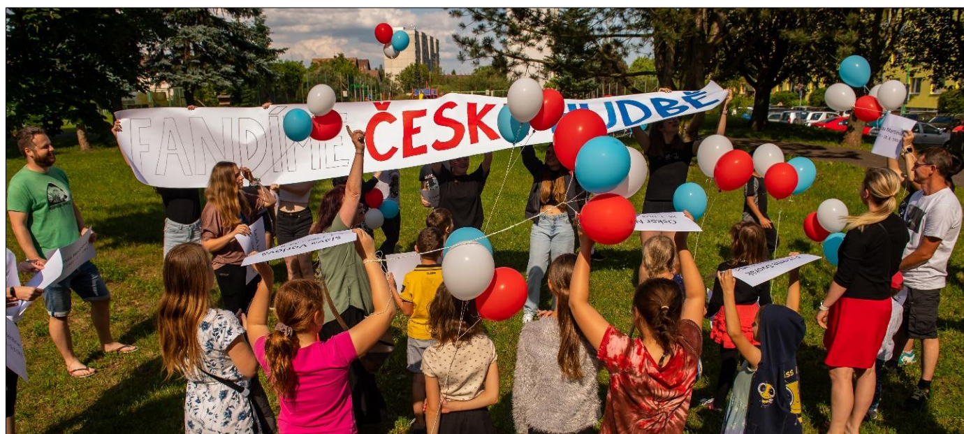
ZUŠ OPEN „Fandíme české hudbě – Otevřete si okna“

Žáci a studenti LDO po celý rok pracovali v redakci školního měsíčníku ZUŠkoviny.