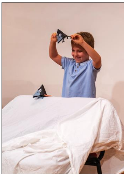
„Přiletěla vrána, sedla na kopec...“