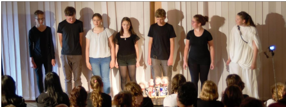
Hejno (Předváděčka dramaťáku)

na pověsti „Střílení k ptáku“. Dokončil marionety na drátě, které už v návrzích ctily téma celé inscenace a vycházely z předmětné metafory a v duchu alternativního herectví připravil premiéru na Předváděčku dramaťáku v červnu.