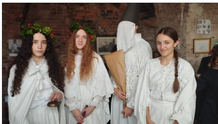
Čerti, Anděl, Barbory, Ambrož a Lucie

V hodinách přednesu hledal kolektivní vyjádření pro experimentující poezii E. Jandla v překladech J. Hiršala a B. Grögerové. Výsledek prezentoval v montáži veršů pod názvem „Vesel u vesel“ na Májovém poetickém podvečeru.