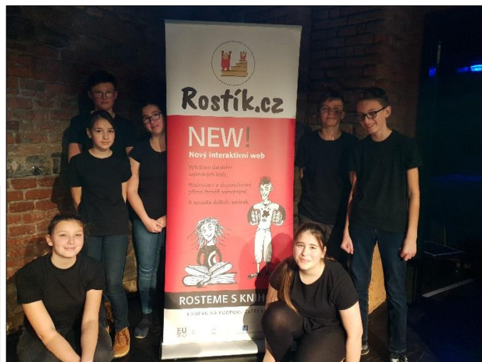
Ruka-kompletní průvodce (finále Čtenáře na jevišti, Praha)