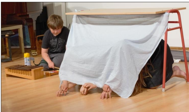
Jak to vzniklo