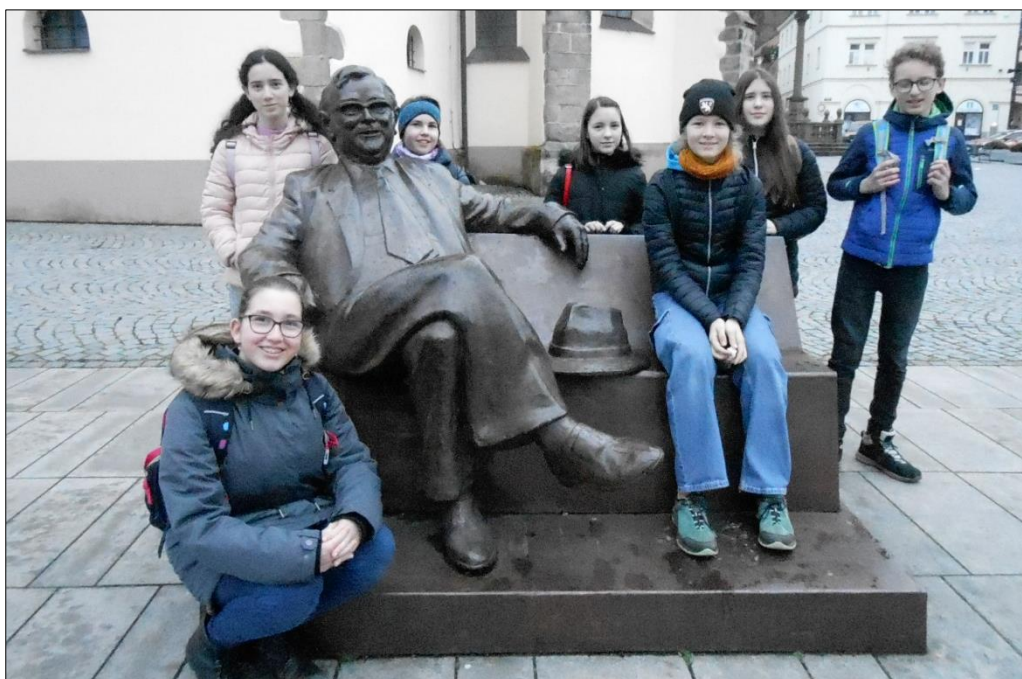
recitátoři 3. a 4. kategorie