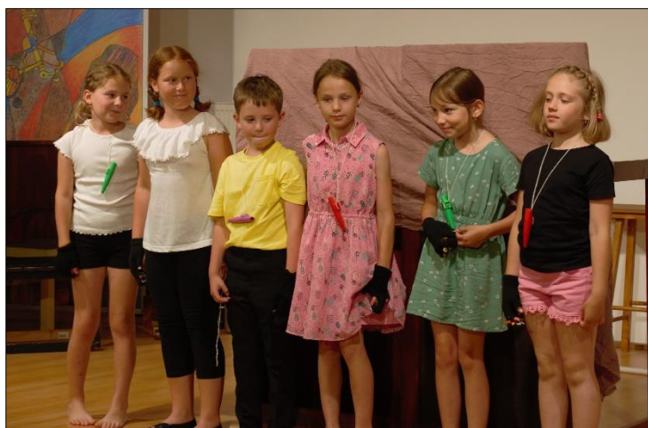
Vařím, vařím koření

Výsledek své práce s materiálem prezentoval na Předváděčce dramatařáku v představení „Pojďme hledat poklady!“, ve kterém předvedl spodové loutky mravenců.