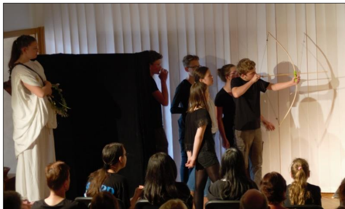
Střelení k ptáku (Předváděčka dramaťáku)

V posledním prosincovém týdnu byl pozván do finále přehlídky ve Švandově divadle v Praze a reprízu uvedl v únoru pro žáky ZŠ speciální, kteří chodí pravidelně do ZUŠky na návštěvu.