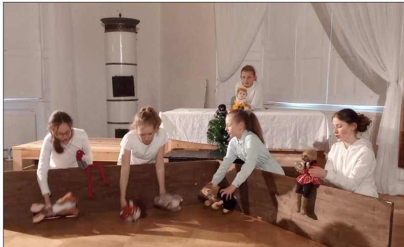
Putování s jezevcem-část čtvrtá: Jezevcovo překvapení (Choceň)

S respektem se zapojil do fungující formy, vybral si část z příběhu, hrací prostor a s chutí se zapojil do jarního víkendového maratonu, kdy účinkoval v předposlední části „Putování s jezevcem“, podle nonsensové pohádky P. Ouředníka „O princí Čekankovi“ a v seriálovém pojetí svou část zahrál sedmkrát. Byla to pro soubor úplně nová zkušenost a prověrka společných sil.