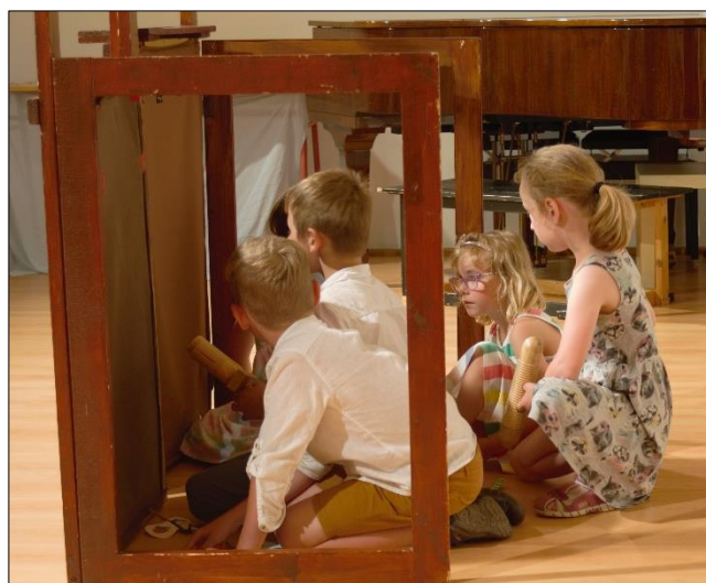
Posadím se na motýla, poletíme spolu strání, posadím se na motýla, nikdo mi v tom nezabrání.