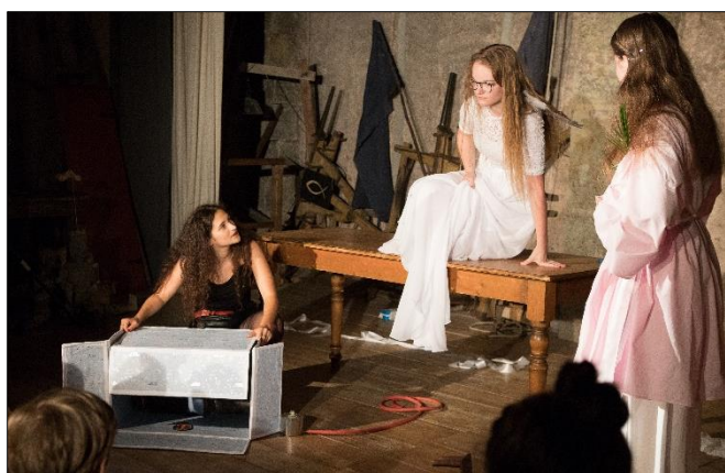
Nová metoda (Theatrum Kuks)

Na společném absolventském koncertě v červnu soubor odpremiéroval inscenaci „Nová metoda“, kterou vytvářel na zadání pro multižánrový barokní festival Theatrum Kuks , kde v srpnu proběhla druhá úspěšná premiéra.