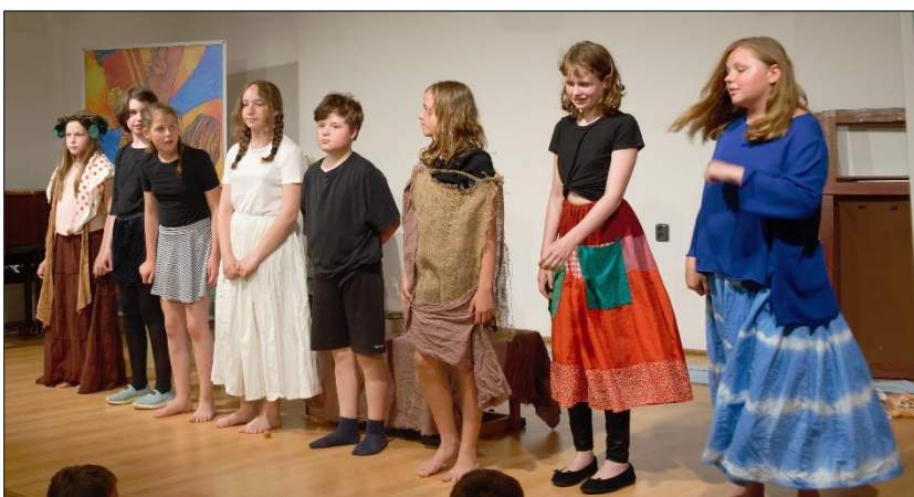
O slepičce a kohoutkovi: Leží tam na dvoře, má nožky nahoře... (Předváděčka dramaťáku)

Soubor Možná už jo! tvořily žákyně 4. a 6. ročníku. Pro svou celoroční práci si po dramaturgických úvahách a diskuzích vybraly antickou báji o Meleagrovi z knihy E. Petišky „Staré řecké báje a pověsti“.