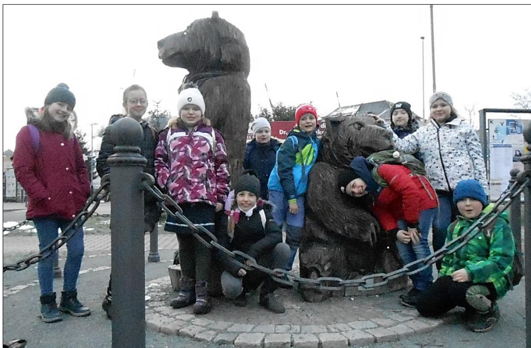
Účastníci okresního kola Dětské scény – recitátoři 2. kategorie