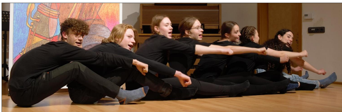
Vesel u vesel, den co den, vesel u vesel... (Májový poetický podvečer)

V hodinách přednesu hledal kolektivní vyjádření pro experimentující poezii E. Jandla v překladech J. Hiršala a B. Grögerové. Výsledek prezentoval v montáži veršů pod názvem „Vesel u vesel“ na Májovém poetickém podvečeru.