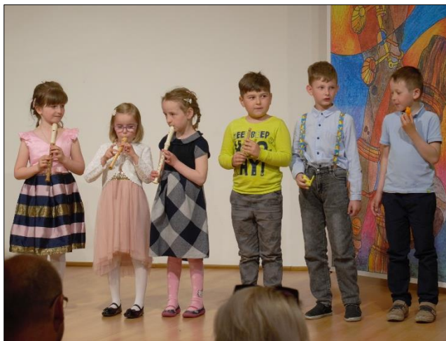
Sotva ráno vstane ptáček, hned si píská na zobáček

Školní rok 2022-23 byl pro literárně dramatický obor naplněný pro něj tradičními akcemi, účast na nich se postupně napříč oborem předává a posouvá. Žáky tak čekají nové zkušenosti, které jim přinášejí důležité zážitky i úspěchy.