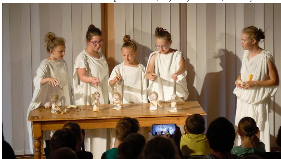
Masakr kalydonský (Předváděčka dramaťáku)

Soubor se souběžně připravoval na svou první účast v tradiční divadelní akci Putování v Choceň.