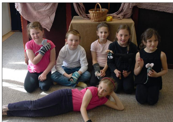
V koutě jedné zahrady byla myši díra a v ní bydlely dvě myšky, myška Eliška a myšák Jarouš.

Třetí ročník animoval vlastnoručně vyrobenou plošnou loutku, což předvedl v krátké klauniádě pod názvem „Klauni“ na Naší úrodu. Pro program Vánočního koncertu připravil Pastýřskou hru formou stínohry. V autorské inscenaci se nechal inspirovat biblickým příběhem o stvoření světa, použil v ní ruku jako postavu-loutku a pod názvem „Jak to vzniklo“ ji uvedl na Předváděčce dramatařáku