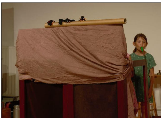
Pojďme hledat poklady, najdeme jich hromady!