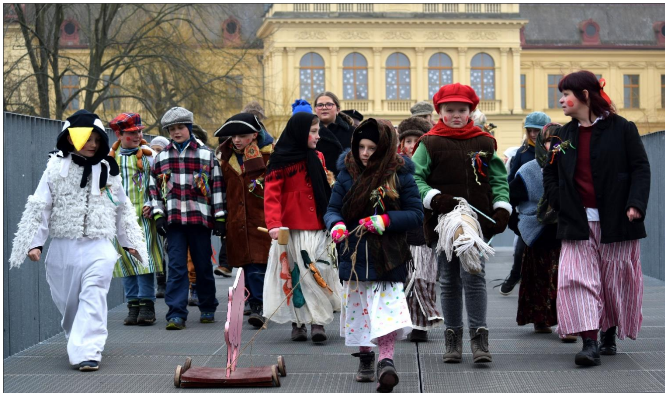
My jsme se k vám přišli ptáti, smíme-li tu zadupati...

Žáci a studenti literárně dramatického oboru se pravidelně účastní Masopustního průvodu v Jaroměři a navazujícího Masopustního ohlédnutí v Domově sv. Josefa v Žirči, kam tradičně jezdí předat výsledek masopustního koledování a rozveselit klienty nemocné roztroušenou sklerózou.