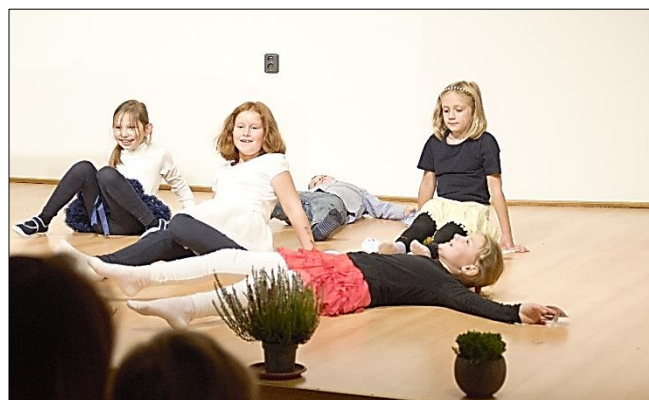
Dešťové kapičky dostaly nožičky...

První ročník se představil hned na začátku školního roku na prvním podzimním koncertu Naše úrodučka s pohybovým rytmizovaným pásmem doplněným říkankami pod názvem „Dešťové kapičky“.