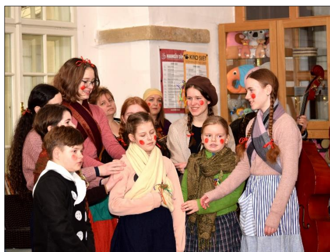
Vinšujem vám štěstí, zdraví, čtyry chlívky, žádný krávy...

Ve školním roce vycházel 17. ročník časopisu ZUŠkoviny, měsíčníku ZUŠ F. A. Šporka, v jehož redakční radě pracovalo sedm žáků a studentů LDO.