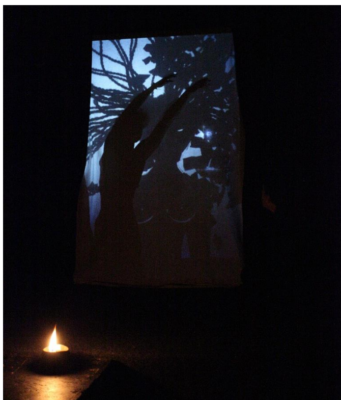
Svět je v rozpacích

Při hledání divadelních výrazových prostředků došel ke stínohře na meotaru, vybral několik původních bájí ze zápisků K. Rasmussena a vytvořil autorskou inscenaci „Svět je v rozpacích“, která se po dozkoušení hrála i na festivalu Na sever v Chocni a v programu Jařince.