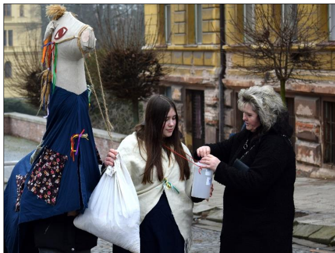
Kupte klibnu, hospodáři!