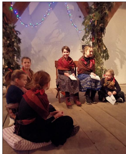
Když v prosinci mrzne a sněží, úrodný rok na to běží.