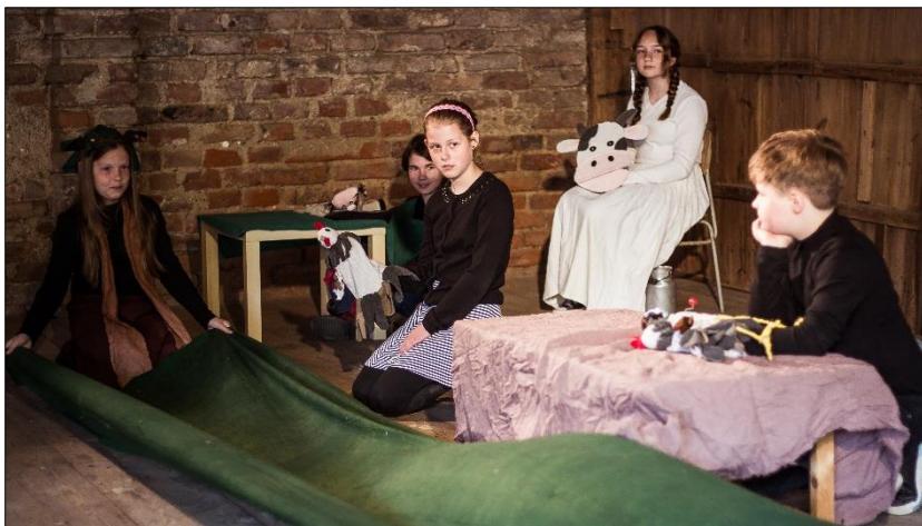
O slepičce a kohoutkovi (Jařinec)

K dramaturgické práci si soubor vybral pohádku „O slepičce a kohoutkovi“ B. Němcové, kterou po svém zpracoval, vymyslel a vyrobil scénografii a jednoduché loutky. Pohádku zahrál na festivalu Jařinec a na Předváděčce dramaťáku v červnu.