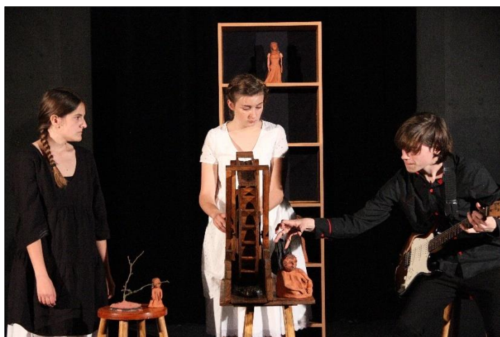
„Hra o duši“