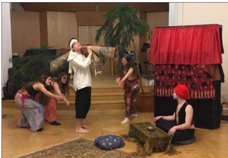
„Putování s námořníkem S“ v Chocni

Soubor Convivium měl už poslední dva členy, kteří společně s bývalými členy udrželi pro různé divadelní festivaly úspěšné inscenace z minulého roku. Hned v září na festivalu Zářinec zahrál inscenaci „Erben 1862“. V říjnu se účastnil festivalu Budiž stín s novou meotarovou adaptací povídky K. Čapka „Paštika“ a získal putovní Cenu ředitele festivalu. Inscenace se potom hrála v Chocni a na Audimaforu.