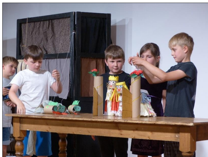
2. ročník: „Horo, horo, bramborová“ a „Pohádka o drakovi“

Žáci 3. a 4. ročníku si vymysleli název pro svůj soubor - Naplno a prezentovali se tak už na listopadové Naší úrodě dramatizací lidových říkadel pod názvem „Ve staré škole“. Další práce směřovala k vánočnímu pásmu „Když v prosinci mrzne a sněží“, ale vánoční vystoupení byla zrušena. Ukázkou soubor přispěl do celoškolního vánočního videa. V rámci přednesu se žáci věnovali E. Fryntovi a jeho sbírce „Písničky bez muziky“. Ke ztvárnění pásma použili předměty a jejich animaci a inscenaci pod názvem „Náš Emanuel Frynta“ předvedli na Předváděčce dramaťáku.