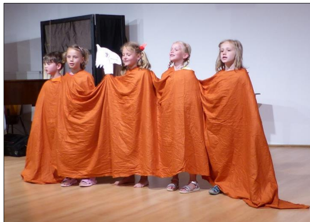
Přípravná dramatická výchova: „Tenhle drak má sedm hlav“

Dětem z Přípravné dramatické výchovy se dařilo ukazovat jeden ze základních principů dramatické hry, jak se učí spolupracovat. Vystoupily na podzimním koncertě Naše úrodička s dramaturgií „V každém jablku je malá jablko“, na koncertě ke Dni matek s básničkou „Kouzelné zrcátko“ a ročníkovou prací zakončily dramaturgií básně Jiřího žáčka „Tenhle drak má sedm hlav“ na Předváděčce dramaturgií v červnu.