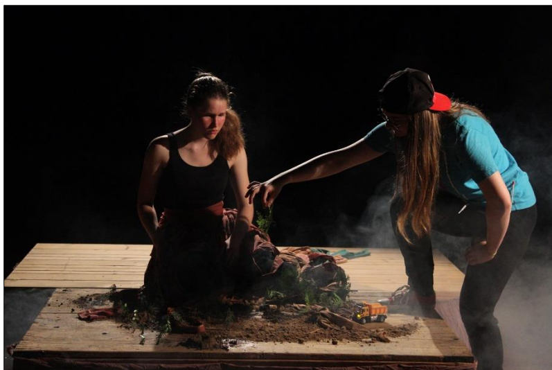
Je to tajný!/: „Jeden“

Na Šrámkově Písku se inscenace úspěšně zahrála a dostala doporučení do hlavního programu Jiráskova Hronova. Z Wolkrova Prostějova si soubor přivezl Cenu poroty za výtvarné řešení. Na Loutkářské Chrudimi a Jiráskově Hronově se inscenace z časových důvodů souboru hrát nemohla.