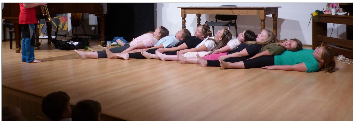
soubor Naplno: „Náš Emanuel Frynta“

Žáci 3. a 4. ročníku si vymysleli název pro svůj soubor - Naplno a prezentovali se tak už na listopadové Naší úrodě dramatizací lidových říkadel pod názvem „Ve staré škole“. Další práce směřovala k vánočnímu pásmu „Když v prosinci mrzne a sněží“, ale vánoční vystoupení byla zrušena. Ukázkou soubor přispěl do celoškolního vánočního videa. V rámci přednesu se žáci věnovali E. Fryntovi a jeho sbírce „Písničky bez muziky“. Ke ztvárnění pásma použili předměty a jejich animaci a inscenaci pod názvem „Náš Emanuel Frynta“ předvedli na Předváděčce dramaťáku.