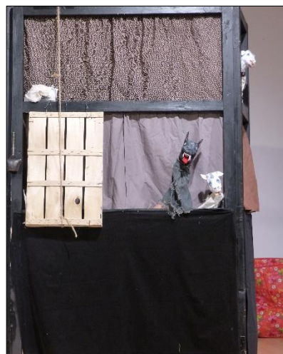
Možná už jo: „Chlapeček a nožičky“ (scénické čtení) a „O neposlušných““