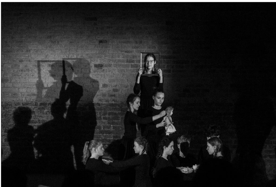
Soubor Popcorn: „Měla to být pohádka“

Soubor Je to tajný zahájil školní rok přípravou performance na festival Budiž stín. Nechal se inspirovat verši Jan Skácela a na dvou meotarech v Poniklé prezentoval inscenaci „Babiho léta dlouhá nit - poezie zpětného projektoru“.