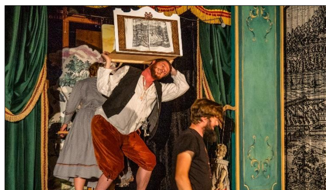
Kolegium hraběte Šporka: „Zlatá jablka...“

Těm, co odcházejí přejme štěstí na jejich další cestě, ať už směřuje kamkoliv!