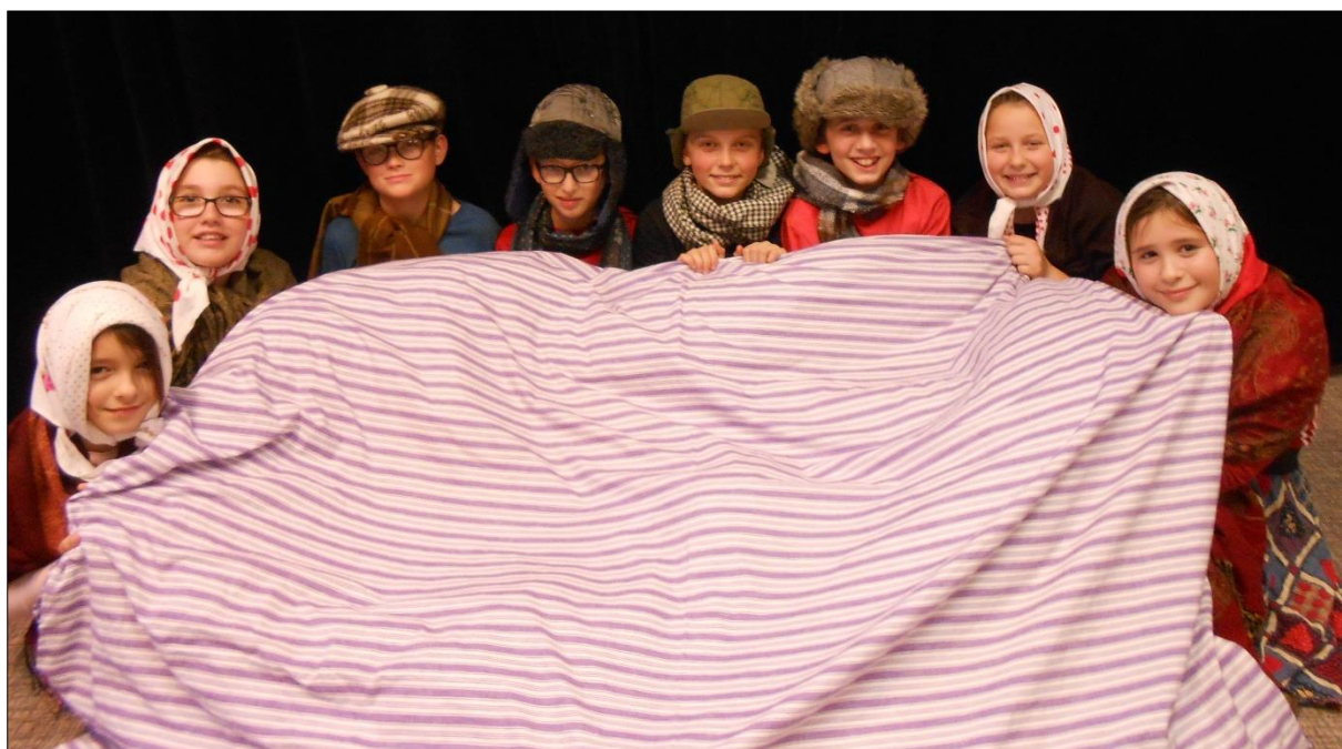
Hejno: „Na Vánoce, dlouhý noce“