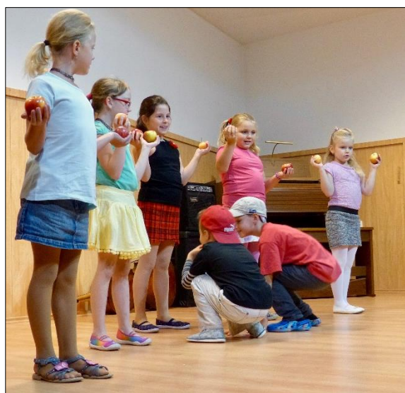
„Stojí jabloň za stodolou“

Žáci 1. a 2. ročníku pracovali ve dvou skupinách. Svá vystoupení měli tradičně už v říjnu na prvním podzimním koncertě „Naše úrodučka“ pod názvy „Stojí jabloň za stodolou“ a „Horo horo bramborová“. Šlo o dramatizace několika lidových říkadel. Potom se obě skupiny zabývaly knížkou D. Mrázkové „Haló, Jacíčku!“, ze které připravovaly úryvky pro březnovou Předváděčku dramaťáku, k prezentaci už nedošlo.