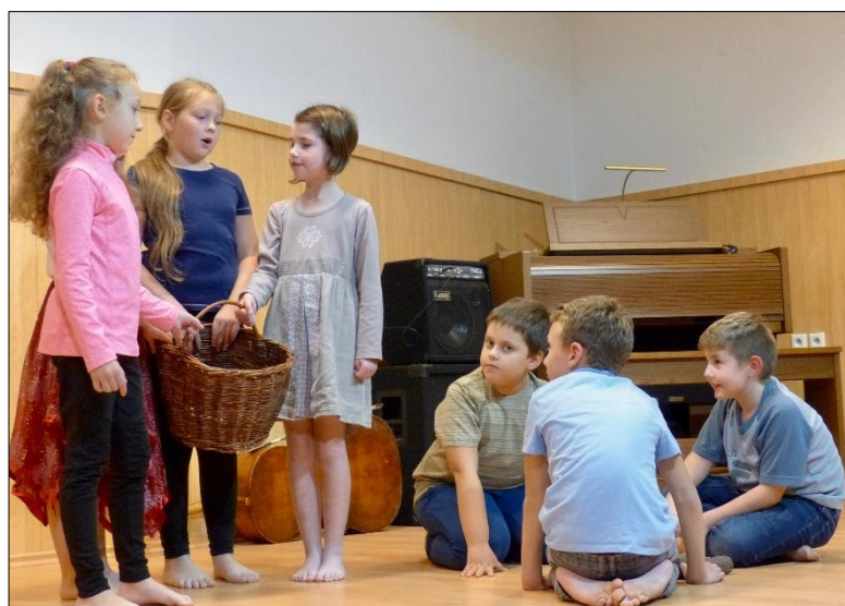
„Horo, horo bramborová...“