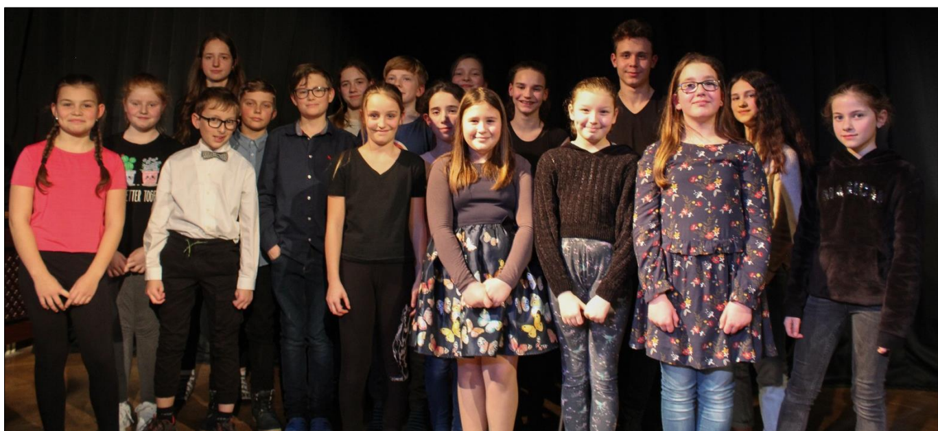
Přehlídka dětských recitátorů (školní kolo v Divadle NaČerno)

Soubor Popcorn připravil na podzimní koncert starších žáků pásmo z limeriků Edwarda Leara s názvem „Byl jeden dědeček za dveřmi“. Prostředkem sdělení se staly oblíbené předměty a soubor sklidl zasloužený úspěch. Potom se vrhnul do individuální interpretace textů, výsledek prezentoval na Přehlídce dětských recitátorů. Práce na souborové inscenaci skončily těsně před premiérou, která se odložila na další školní rok. Soubor porovnal, rozebral a složil podle několika předloh pohádku „Jeníček a Mařenka“ a vymyslel ji pro dvě loutky a měnící se hereckou skupinovou energii.