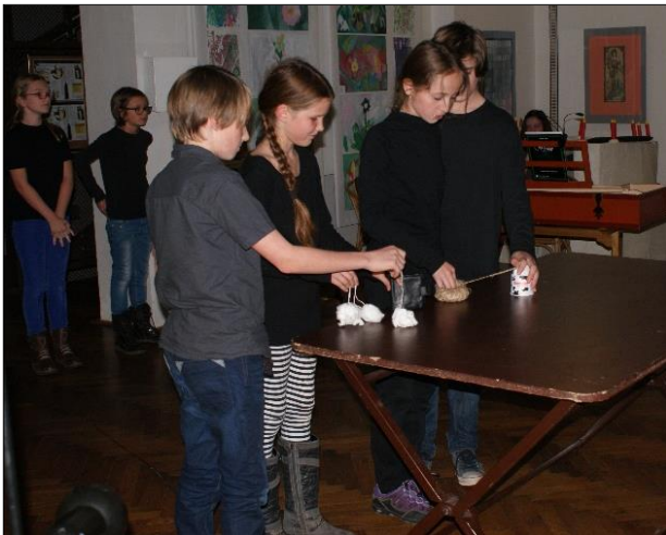
Convivium v Praze (finále projektu Čtenář na jevišti)