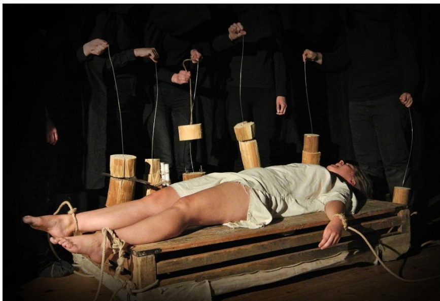
„Kdes holubičko lítala?“