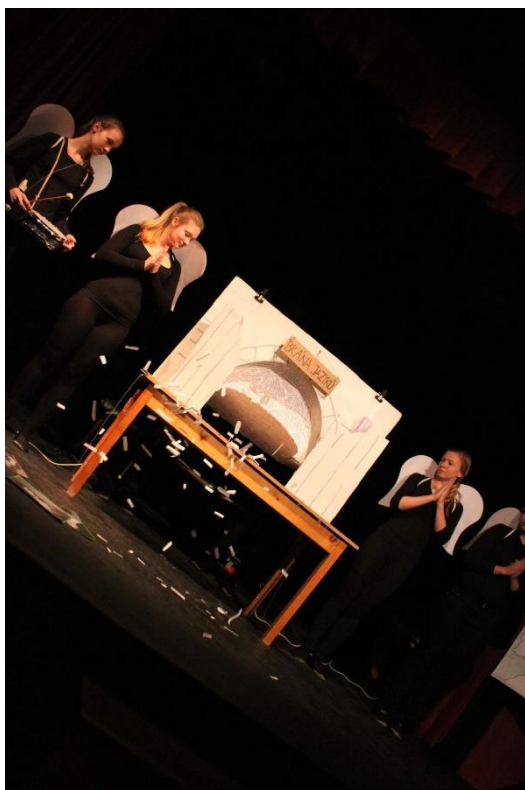
„Putování s Janem Ámošem“