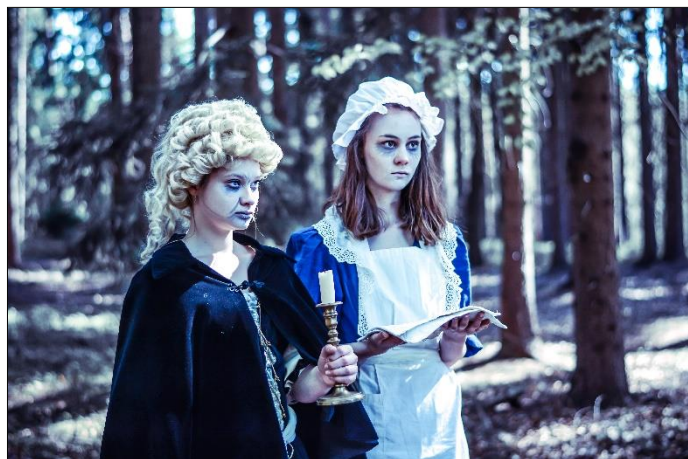
Rej čarodějnic v Betlémě u Kusu