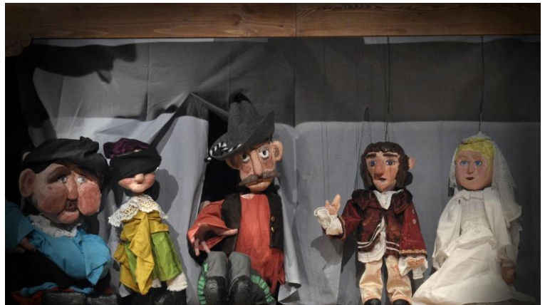
„Dlouhý, Široký a Bystrozraký“