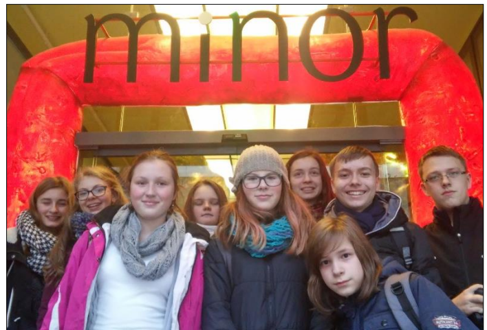
„Jak stařeček měnil, až vyměnil“ (Naše úroda)

Soubor Convivium se na začátku školního roku věnoval scénickému čtení. Jako předlohu si vybral knihu „Hlava v hlavě“ a přihlásil se do projektu Rosteme s knihou „Čtenář na jevišti“. V prosinci byl pozván mezi pět finalistů a hrál v divadle Minor v Praze. Potom pracoval na předloze pohádky K. J. Erbena „Dlouhý, Široký a Bystrozraký“, ke které vyrobil loutky a vymyslel texty k písničkám. Na doporučení poroty okresního kola Dětské scény postoupil do krajského kola v divadle Drak v Hradci Králové, kde získal Cenu za kolektivní herecký výkon a doporučení na Loutkářskou Chrudim a na celostátní Dětskou scénu do Svitav. Na obou přehlídkách byla inscenace diváky moc pěkně přijata.