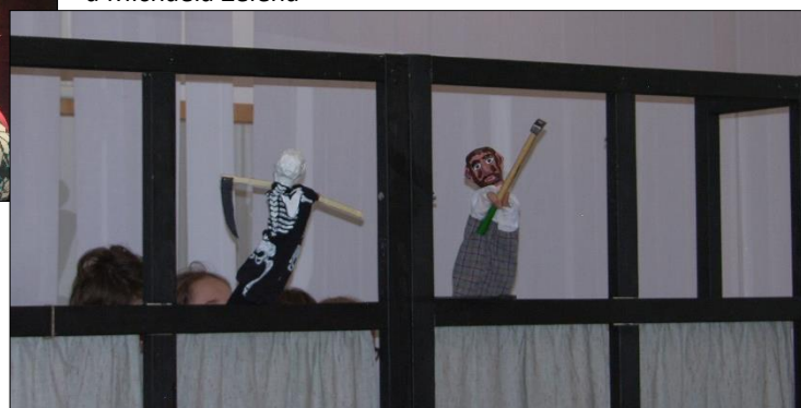
„To je dobře, že je smrt na světě“