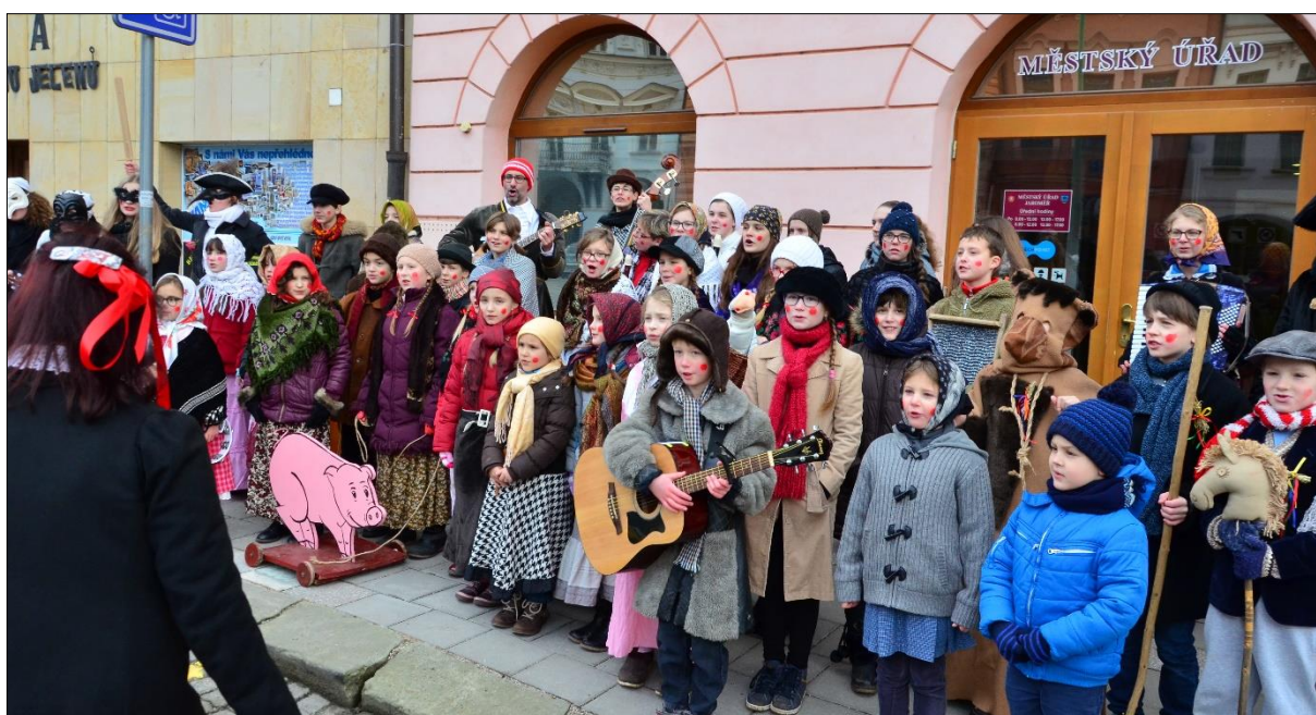
Masopustní průvod v Jaroměři

Žáci všech skupin pravidelně účinkují v Masopustním průvodu v Jaroměři a potom v masopustním programu v Domově sv. Josefa v Žirči, moderují akce školy (koncerty, Šporkovská akademie ZUŠ) a na konci dubna ti nejstarší už podruhé účinkovali v komponované akci Rej čarodějnic v Betlémě u Kuksu. Literárně dramatický obor se velkou měrou podílí na vydávání školního měsíčníku ZUŠkoviny.