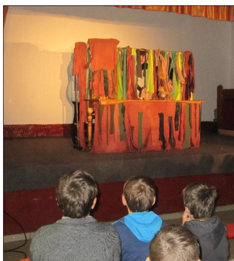
na Svaté Heleně