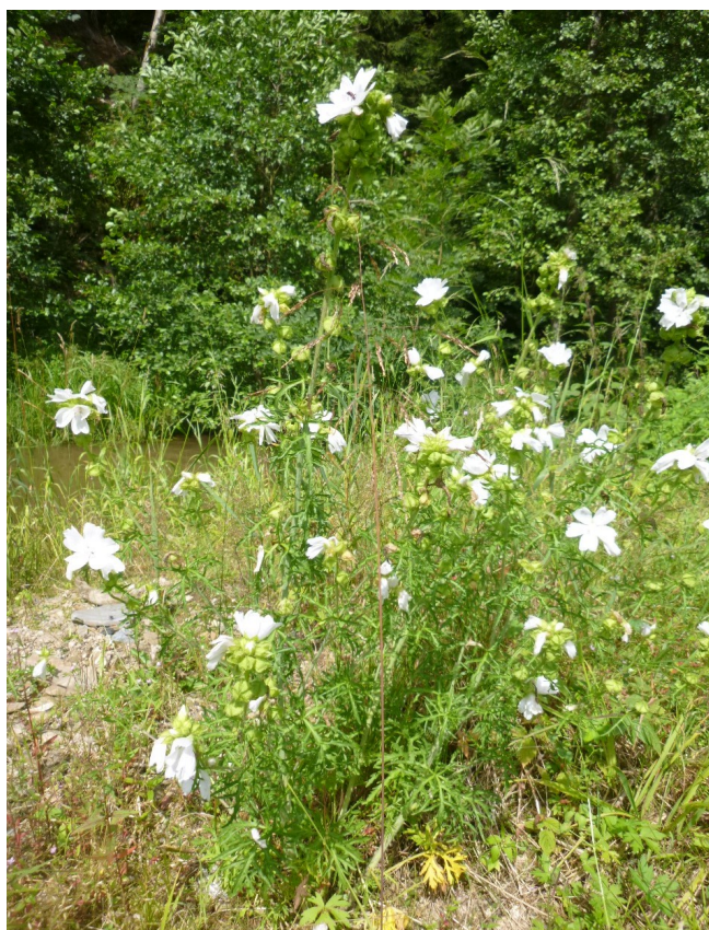
Jirnice modrá Polemonium caeruleum, albinická forma, 7/2017