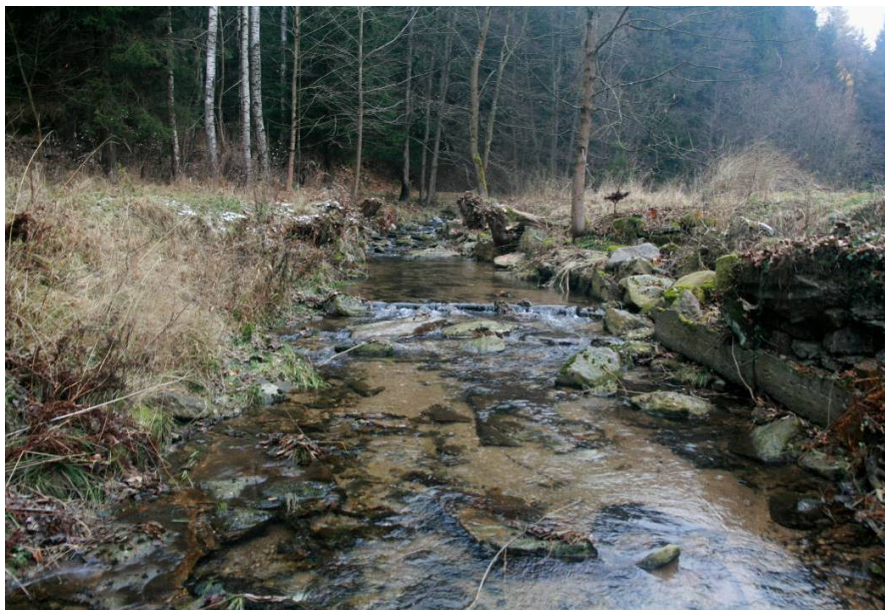
Stříbrný potok – severní část ZÚ (od J), 11/2016