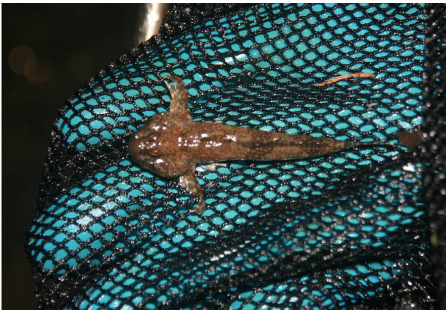
Vranka obecná, 11/2016