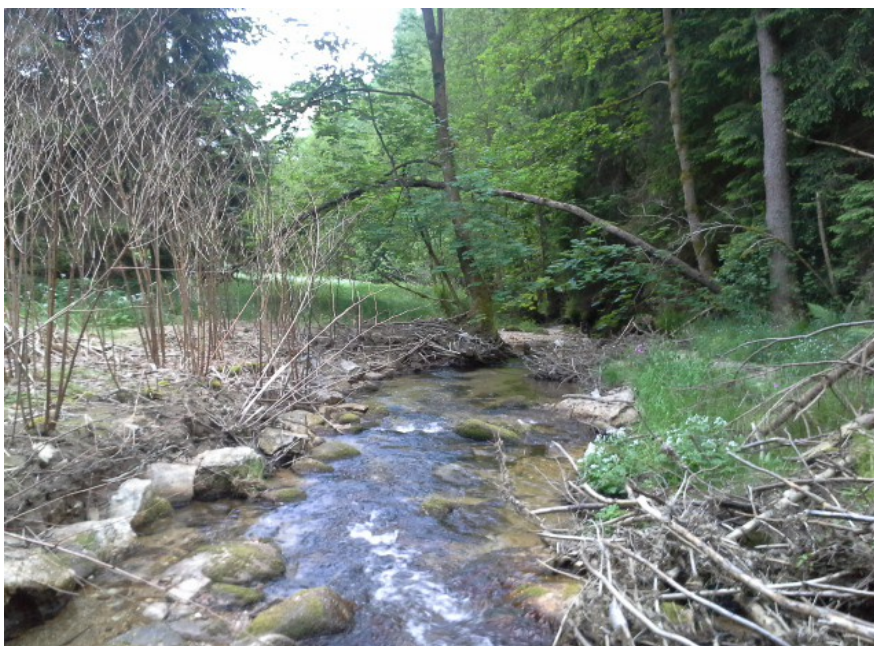
Stř. potok blízko budoucí hráze (S nad hrází, pohled k J) – náplav s křídlatkou japonskou, 6/2017