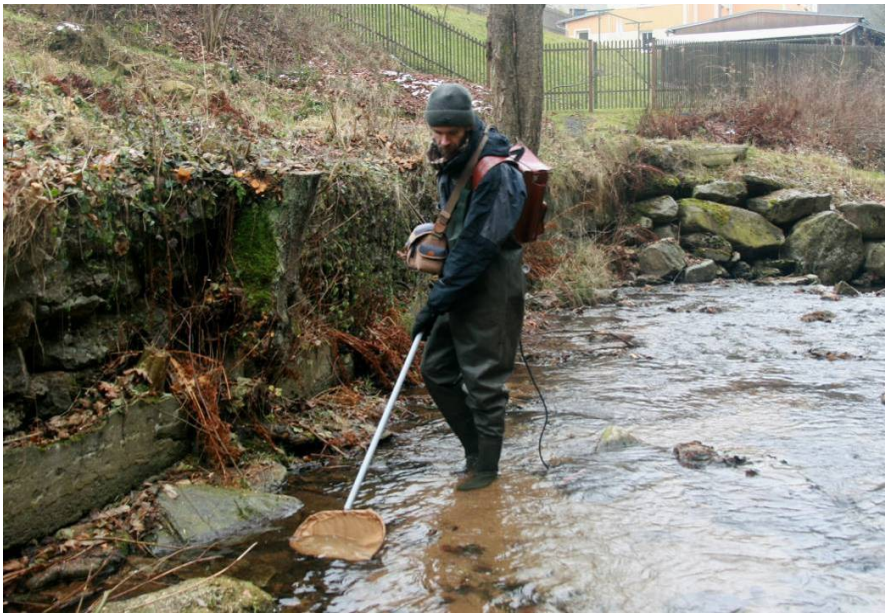
Stříbrný potok – odlov elektroagregátem, 11/2016