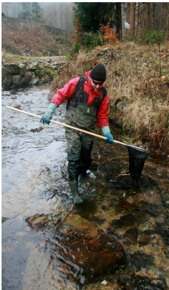
Stříbrný potok – odlov omráčených ryb do keseru, 11/2016