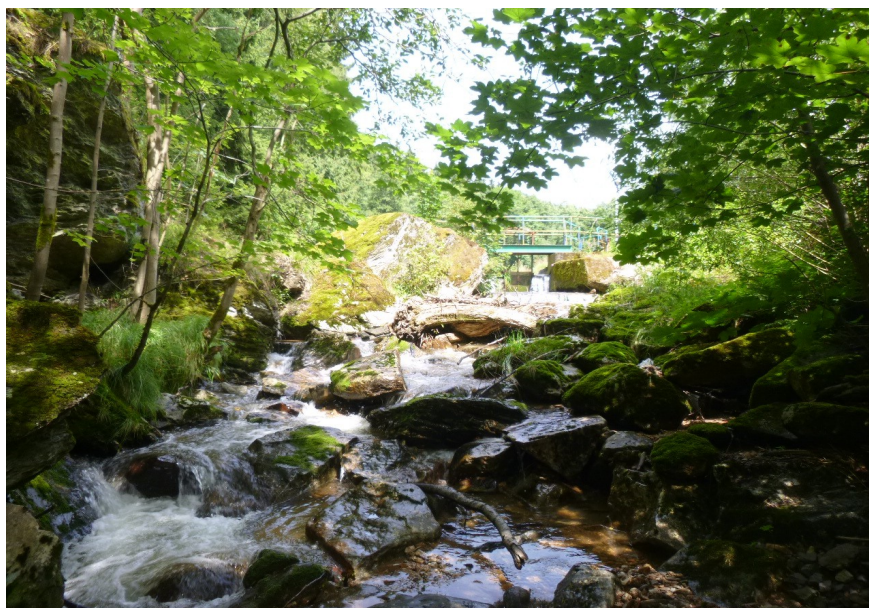
Balvanité koryto pod odběrným objektem, 7/2017