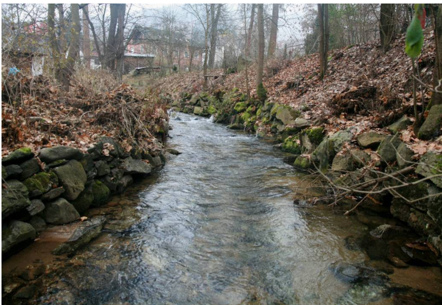
Stříbrný potok – střední část ZÚ (od JZ), 11/2016