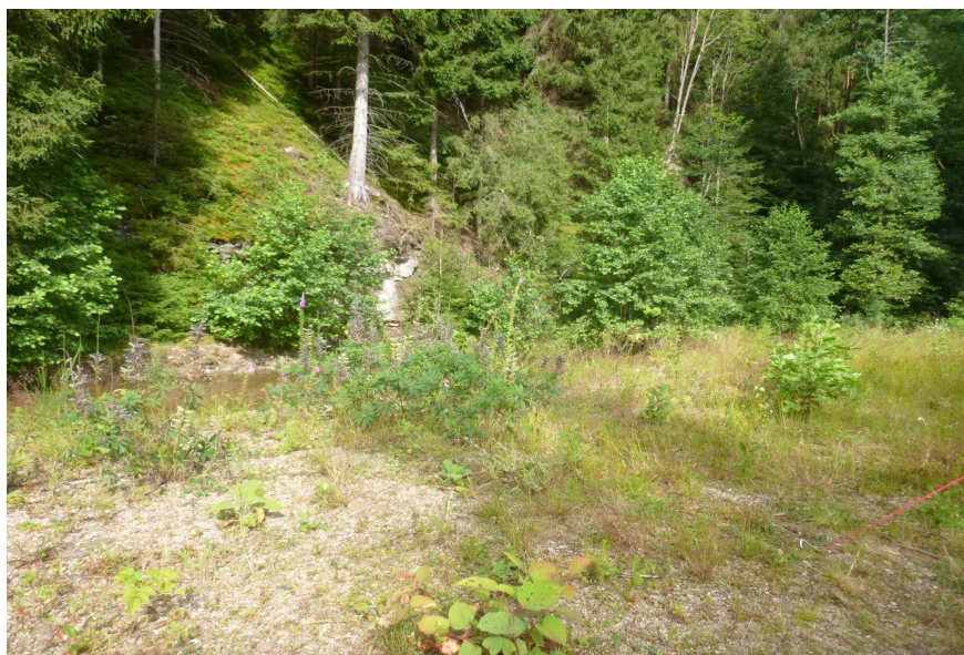
Náplav nad odběrným objektem, na protějším břehu patrná pata svahu se skalní vegetací S1.2, 7/2017