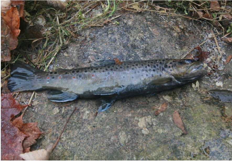
Pstruh obecný – napadený motolicí oční, 11/2016