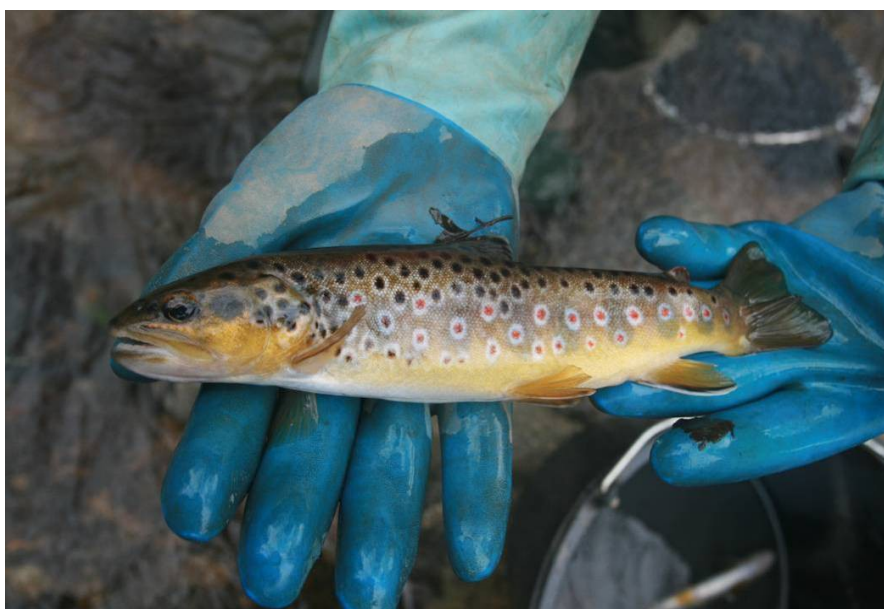
Pstruh obecný, 11/2016