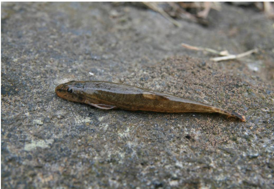
Mřenka mramorovaná, 11/2016