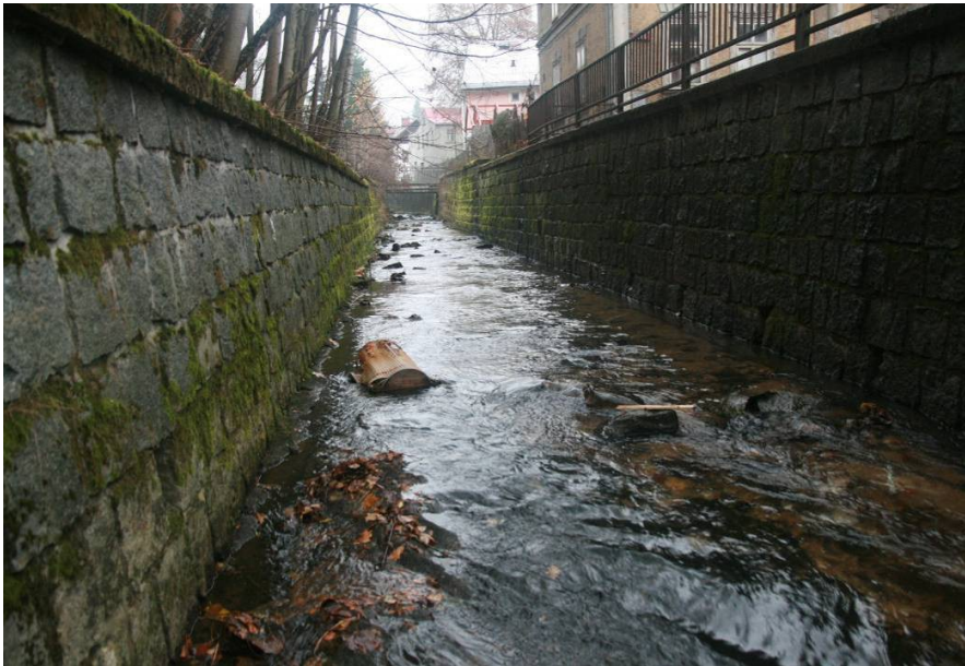
Stříbrný potok – jihuzápadní část ZÚ (od JZ), 11/2016