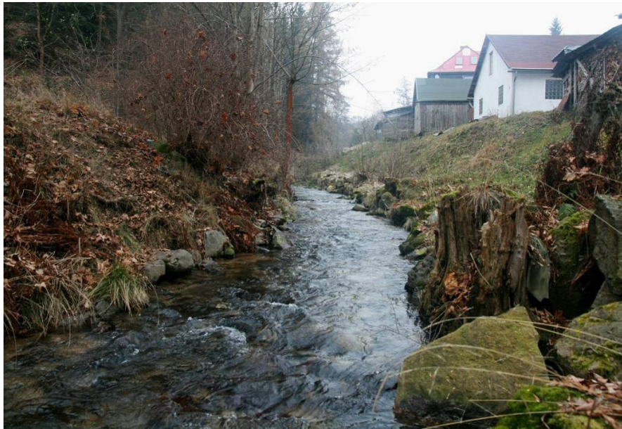
Stříbrný potok – střední část ZÚ (od J), 11/2016