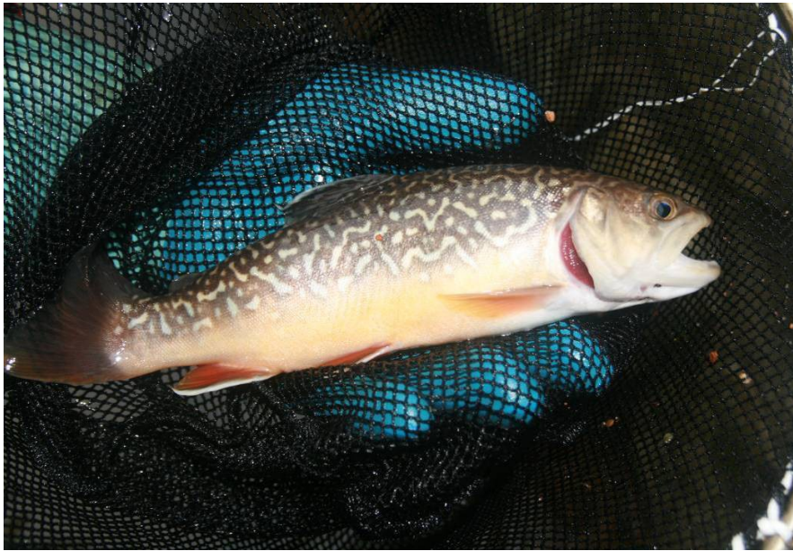
Siven americký, 11/2016